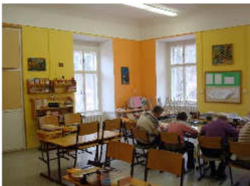
učebna v budově zámku

Někteří klienti dochází do školní třídy, která pracuje s osnovami pomocné školy a zvláštní školy. Tyto třídy byly vytvořeny ve spolupráci se ZŠ, MŠ PŠ Znojmo a jsou zaměřeny na osvojování a opakování čtení, psaní, počítání, pracovní a výtvarné vyučování a tělesnou a hudební výchovu. Jedná se o kurz na doplnění základního vzdělání a kurz na doplnění základů vzdělání. Oba kurzy pracují podle programů pomocní a zvláštní školy.