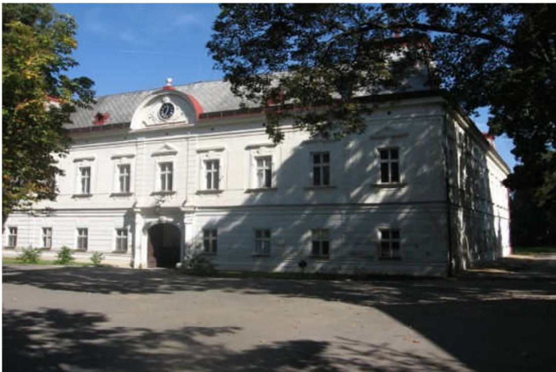
budova zámku (byty klientů, aktivizační dílny - č.p. 2)