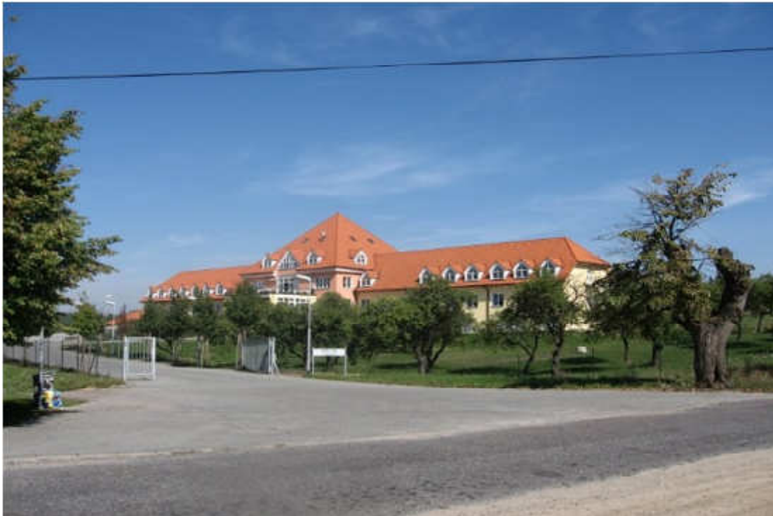
hlavní budova Domova (č.p. 153)