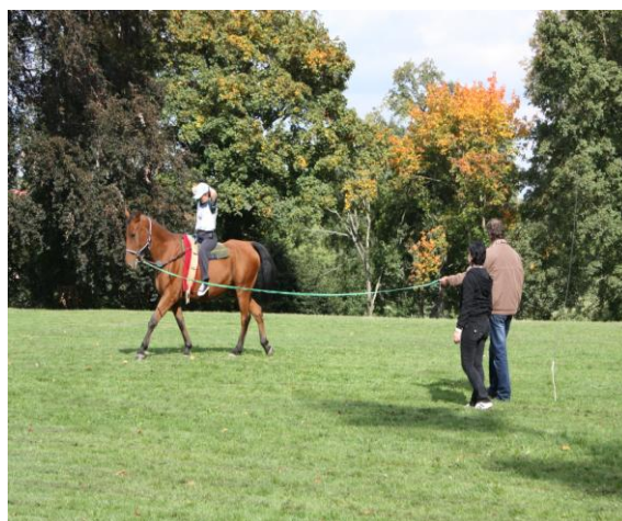
sportovní den – ukázka hiporehabilitace