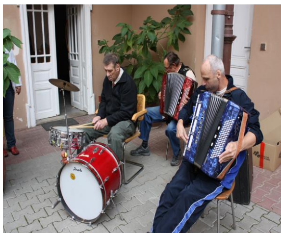
sportovní den – hrála i naše kapela

Každý měsíc jezdí klienti se svými klíčovými pracovníky na výlety do přilehlých větších měst (Moravský Krumlov, Znojmo, Brno, Ivančice) na nákupy, navštěvují knihovnu, kina, hřbitovy, popřípadě místa, kde žili.