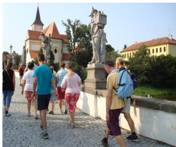
turisticko-sportovní tábor v Hartvíkovicích